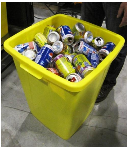
Volume latas original