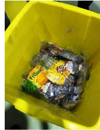
Volume plástico após compactação