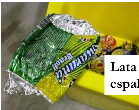
Lata fica espalmada

Grau de Compactação é de 7 : 1 Volumetria original reduz-se 7 vezes.