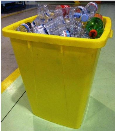
Volume plástico original